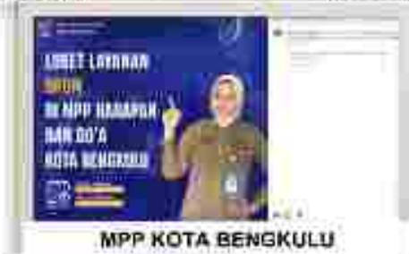
MPP KOTA BENGKULU