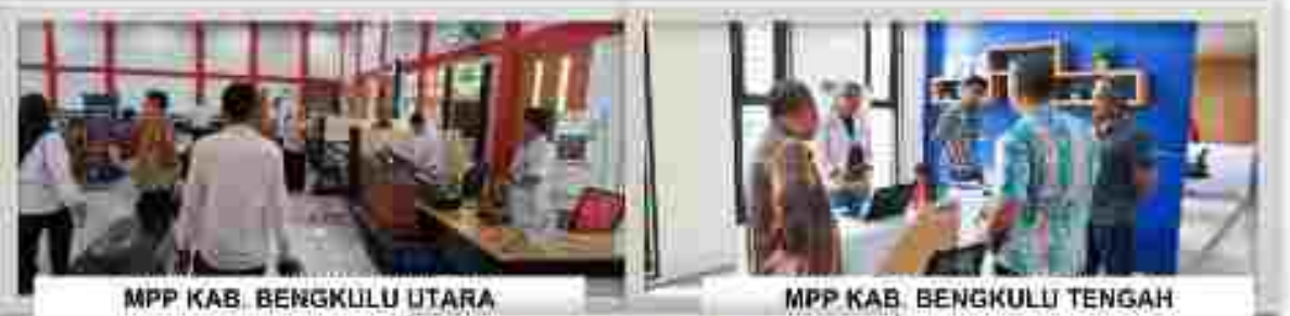
MPP KAB. BENGKULU UTARA