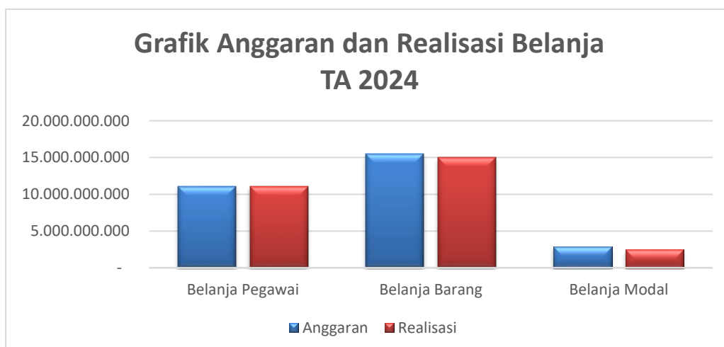
Gambar 1. Komposisi Anggaran dan Realisasi Belanja

Komposisi anggaran dan realisasi belanja dapat dilihat dalam grafik berikut ini :